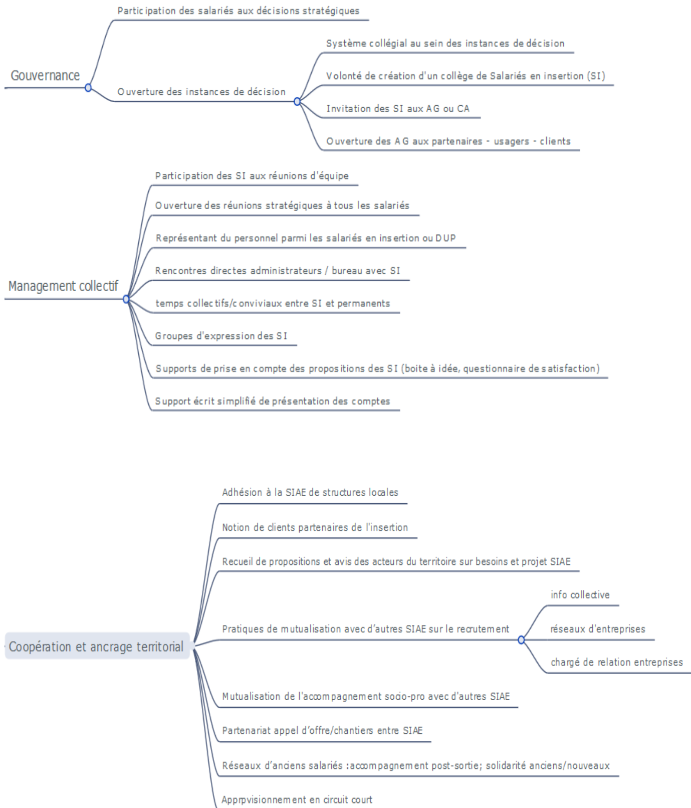
Schéma récapitulatif des pratiques remarquables et innovantes repérées